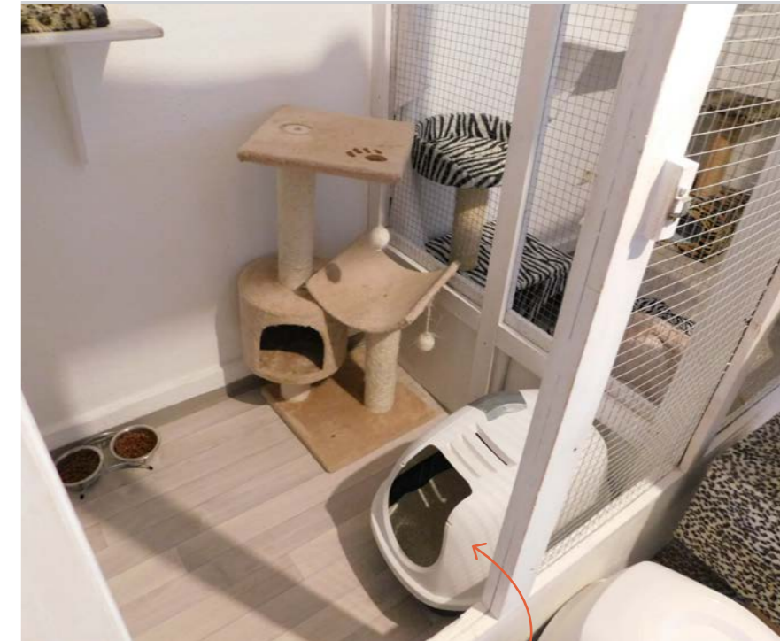
Ein Einzelzimmer, bitte! Auch von den Einzelabteilen aus können die Katzen alles ganz genau beobachten