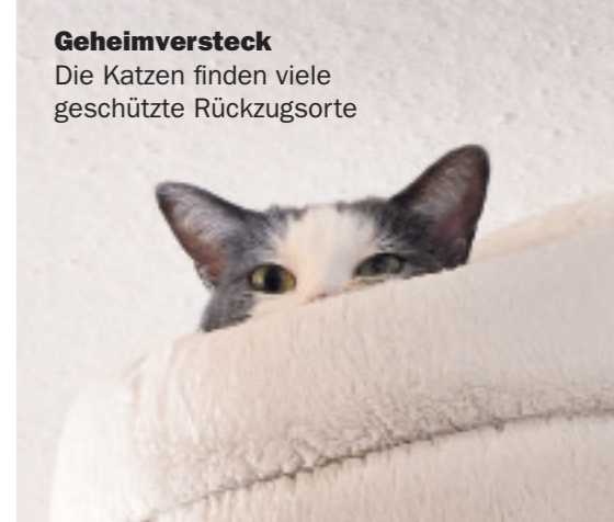
Geheimversteck Die Katzen finden viele geschützte Rückzugsorte

„Viele Katzen stehen unter großem Stress, wenn sie ihr gewohntes Umfeld verlassen müssen. Dann brechen