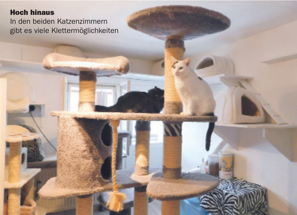
Hoch hinaus In den beiden Katzenzimmern gibt es viele Klettermöglichkeiten