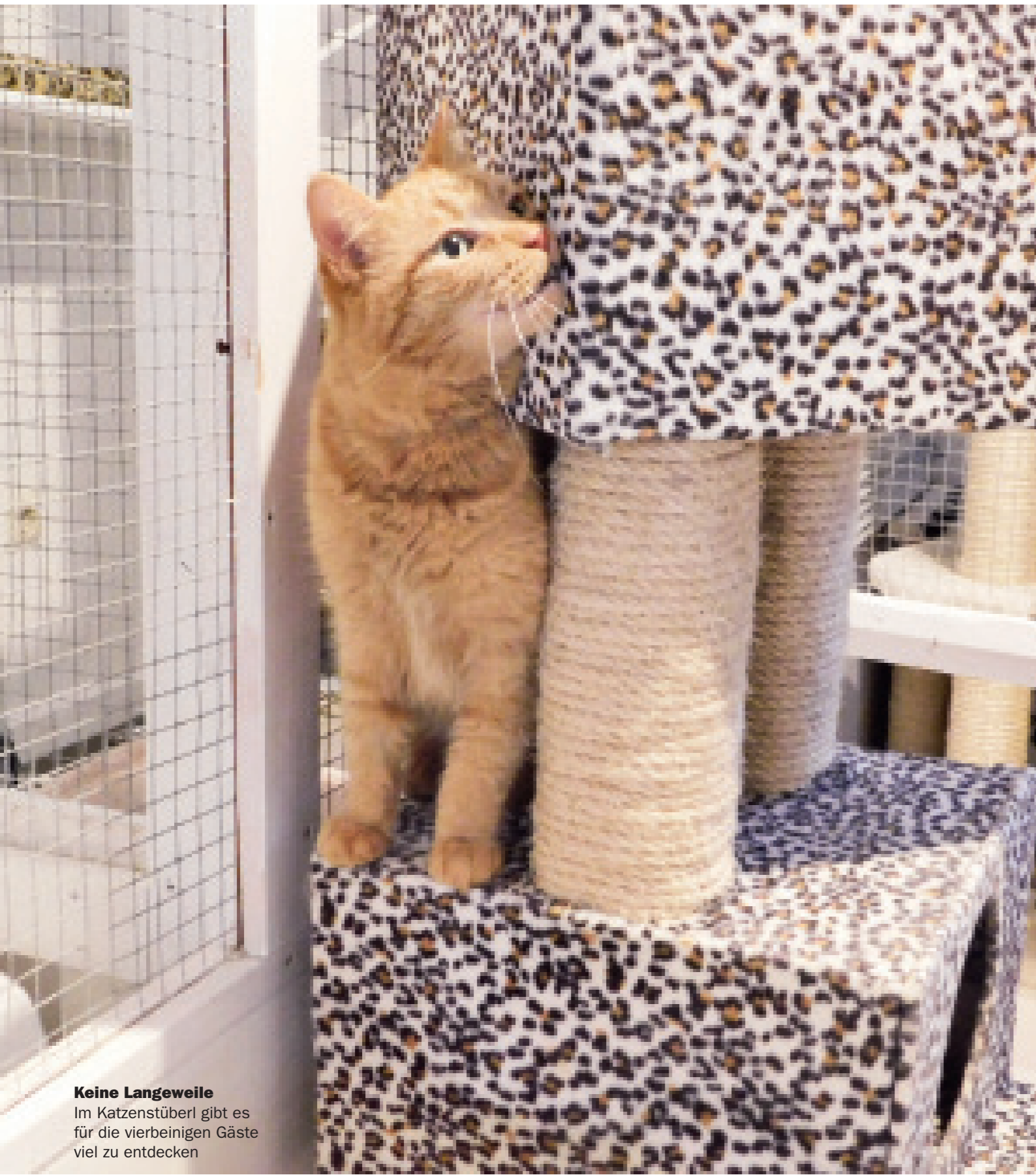
Keine Langeweile Im Katzenstüberl gibt es für die vierbeinigen Gäste viel zu entdecken