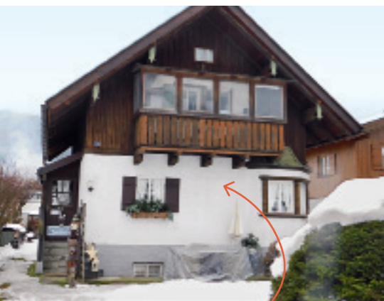
Zimmer mit Aussicht Vom gut abgesicherten Balkon aus können die Katzen alles beobachten